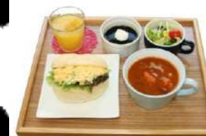
ワンコインランチ