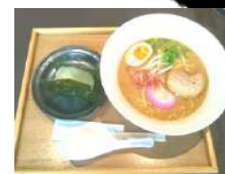
ワンコイン ゆず塩ラーメン