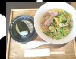
ワンコイン ガッツリ男ラーメン